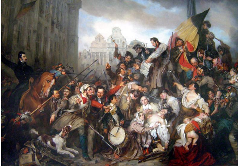
Gustaaf Wappers - Tafereel van de Septemberdagen 1830 op de Grote Markt te Brussel